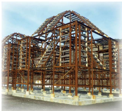
シェルナース 6.0 型 (礁高 8m 378 空 m )