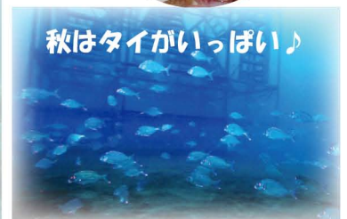
マダイの群れ (2019 年 9 月)