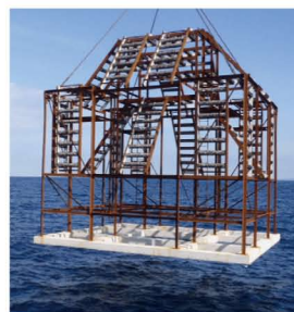
シェルナース 6.0 型 (礁高 8m 378 空 m )