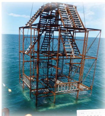
シェルナース 10.0 型 (礁高 12m 607 空 m )