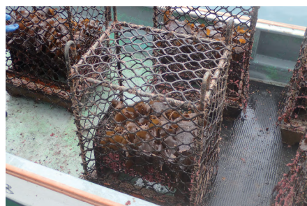
貝藻くんのでクロメが生長

貝藻くんを使用した藻場の回復や環境学習、イベントのお手伝いなど、様々な取り組みに参加しています。