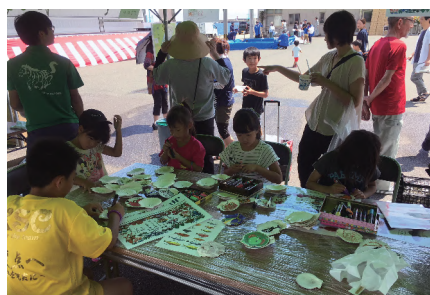
漁協イベントへの参加